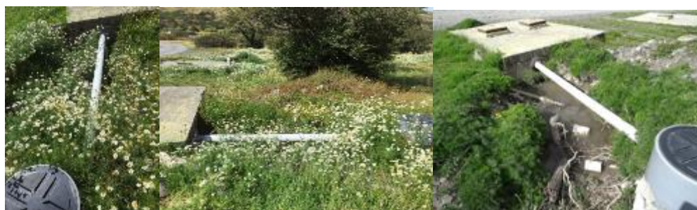
Imagen: Izquierda y centro, situación de la cámara al 29 de abril de 2018. Derecha, situación que dio origen a las observaciones de la inspección del SMA.

La acumulación de líquidos residuales provenientes de la conexión del tubo y de otro origen y la fosa que recibe los residuos líquidos domiciliarios ocupa a un área de 3,84 m 2 que se encuentran dentro del área prospectada para evaluación de flora y fauna para Hotel las Torres. La imagen 2 muestra que la acumulación se produce en una depresión del relieve que se convierte en un punto de acumulación de líquidos. Es posible de observar que alrededor de dicha superficie existe una gran proliferación de Tripleurospermum perforatum , especie exótica presente en el resto del área, en Torres del Paine y la región de Magallanes.