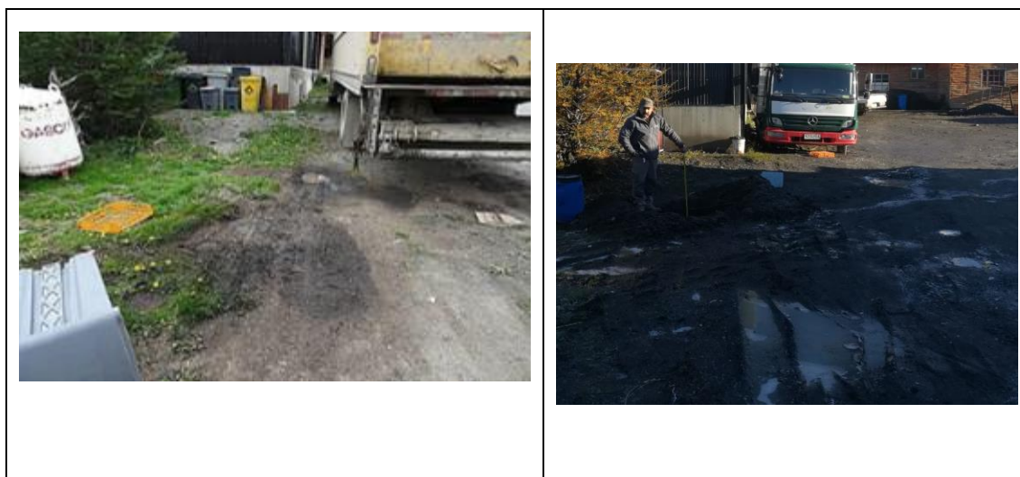
Imagen 5: Izquierda, situación observada durante la inspección y a la derecha, imagen tomada al día 29 de abril de 2018.

Actualmente el área objeto de la observación está desprovista de vegetación y no es posible observar la proliferación de plantas que probablemente no se desarrollan por el tránsito de vehículos en el sector, la construcción de la calicata o simplemente porque naturalmente muchas pierden parte de sus estructuras al entrar en época invernal sobre todo cuando no se dan las condiciones para la mantención de sus hojas (uso del suelo para transitar). Sin embargo, cerca del punto existe la presencia de ejemplares de plantas que actualmente se mantienen en el lugar (Imagen 6).