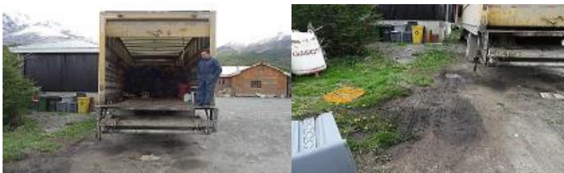
Imagen 3: Vista general vertido de percolados sobre el suelo descubierto, producto del escurrimiento desde un camión de transporte de residuos domiciliarios (E-10).

La segunda observación relevante está dada por la detección de varias manchas de tono distinto a la superficie general del suelo en una extensión de 9m 2 aproximados ubicada en un sector de tránsito peatonal y vehicular en la estación E-10, área que además es utilizada para el estacionamiento de vehículos. Al momento de la inspección en el punto indicado se encontraba un camión de acopio y transporte de residuos domiciliarios a un costado de esta mancha, atribuyéndose como causa del origen de la mancha la fuga de líquidos percolados provenientes del camión (Imagen 3). Se establece mediante observación al interior del camión evidencia de escurrimientos que no son medidos para establecer que el volumen vertido es suficiente para generar un empozamiento de la magnitud en superficie observada, también se hace alusión a la presencia de moscas, aves y olorsimila a residuos domiciliarios, elementos utilizados para reforzar la conclusión del origen de las sustancias que dieron origen a la mancha. No se recogen muestras y/o realizan análisis químicos de los líquidos o componentes de la mancha presente en el suelo.