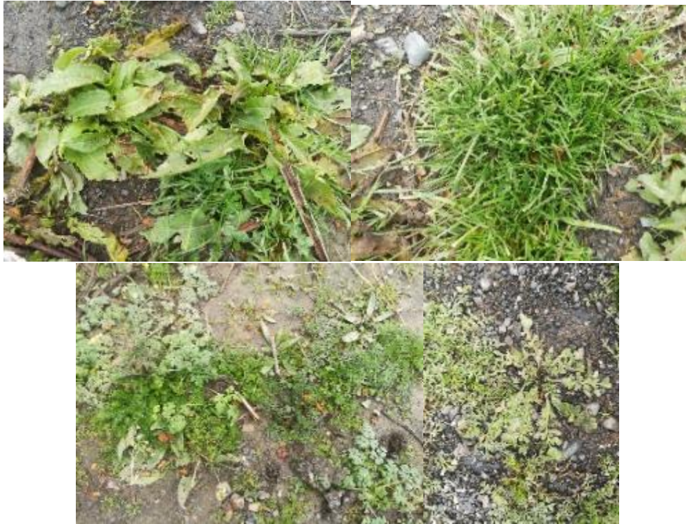
Imagen 6: Plantas posibles de observar en punto objeto de observación por SMA. Fotografía tomada 29 de abril de 2018.

Es importante señalar que; fundamentalmente debido al uso y no respecto al empozamiento de los líquidos observados en la supervisión, la probabilidad de proliferación y prendimiento de especies vegetales debiese ser más bien baja; sin embargo, mediante inspección realizada en el lugar y pese al frecuente tránsito de vehículos en el área, es posible encontrar ejemplares correspondientes a las siguientes especies todas de origen exótico presentes en toda la región de Magallanes (Imagen 6):