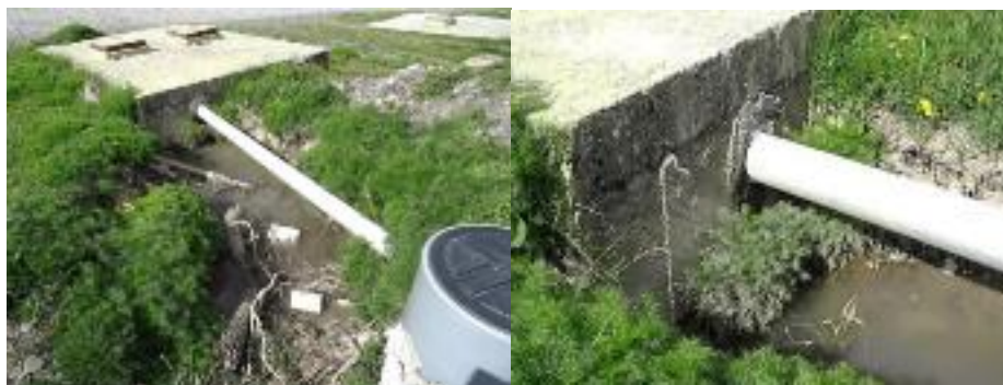
Imagen 2: Vista en detalle de zona de filtración de las aguas servidas contenidas en la fosa séptica de la Villa de personal (E-26).

Se observa una filtración, pero no se mide el volumen de líquidos fugados por unidad de tiempo u otra técnica que permita corroborar que la acumulación corresponde en su totalidad a la filtración. También se hace alusión a la permeabilidad de la cámara la cual no fue evaluada mediante pruebas técnicas de mediciones de permeabilidad de la infraestructura u otra técnica válida que sirva para estos efectos.